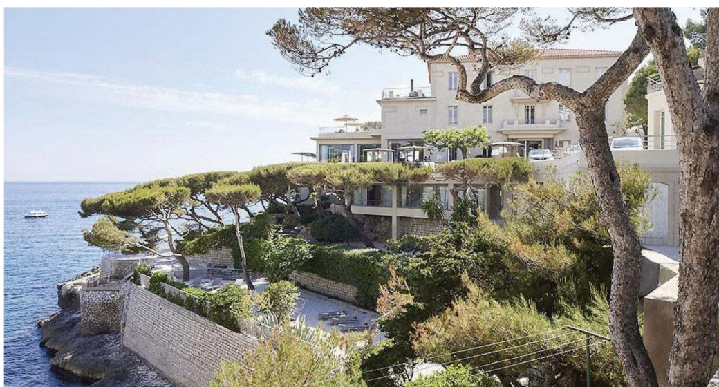
Les Roches Blanches

Le 09/07 à 12:47 / Mis à jour le 10/07 à 15:32